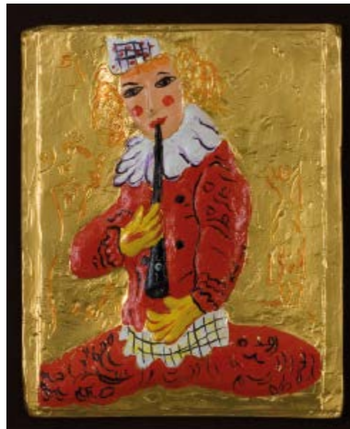
200 Marc Chagall (1887-1985) Base d'asta € 600 Clown flautista - Bassorilievo su lastra immersa in oro e argento 1000/1000, es. 153/499 cm. 30x25 Certificato di Garanzia a cura dell'Istituto Grafico Italiano, Milano sul retro