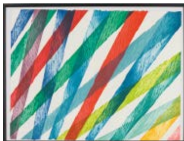
235 Piero Dorazio (1927-2005) Base d'asta € 200 Senza titolo - 1992 Acquafornte su carta, es. 144/150 cm. 57x76 Timbro a secco della Grafica d'Arte Lombardi, Roma in bassi a sinistra Firma e data in basso a destra