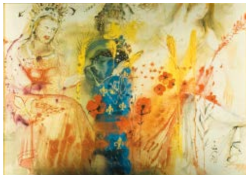
203 Salvador Dalí (1904-1989) Base d'asta € 500 L'estate - Stampa su lastra d'argento 925/1000, es. 114/599 cm. 21x29 Certificato di garanzia con foto a cura della Les Heures Claires Edizioni d'Arte, Trento con timbro a secco di Salvador Dalí Firma stampata in basso a destra