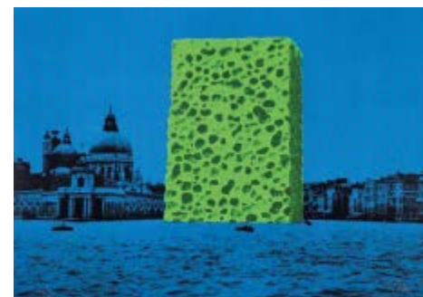
206A Fabrizio Plessi (1940) Base d'asta € 150 Senza titolo - Serigrafia su carta, es. 21/40 cm. 48x68 Firma in basso a destra