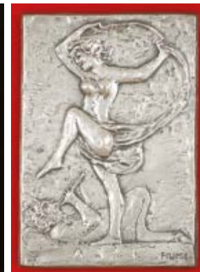
201 Salvatore Fiume (1915-1997) Base d'asta € 200 Satiro e Ninfa - 1987 Bassorilievo in argento 999, es. 17/450 cm. 25x17 Certificato di autenticità a cura dell'Istituto Poligrafico e Zecca di Stato sul retro Firma dell'artista incisa in basso a destra