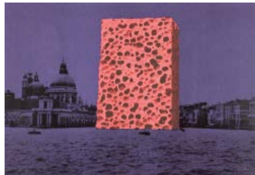
234 Fabrizio Plessi (1940) Base d'asta € 200 Senza titolo - Serigrafia, es. p.d.a. cm. 48x68 Firma in basso a dx