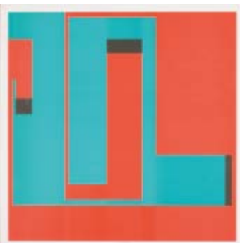
232 Bruno Munari (1907-1998) Base d'asta € 200 Negativo positivo - Serigrafia su carta, es. VI/XXX cm. 70x70 Timbro a secco della Grafica d'Arte Lombardi, Roma in basso a sinistra Firma in basso al centro