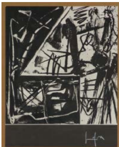
240 Emilio Vedova (1919-2006) Base d'asta € 100 Studio per plurimo - Litografia offset, es. 4176/5000 cm. 30x23 Edizioni BolaffiArte Firma in basso a destra