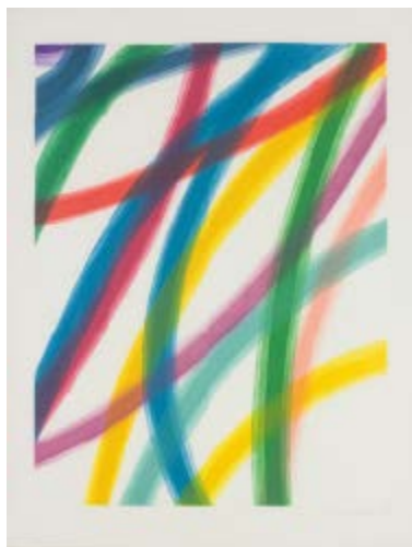
239 Piero Dorazio (1927-2005) Base d'asta € 200 Senza titolo - 1991 Acquafornte su carta, es. 85/130 cm. 76x58 Timbro a secco della Grafica d'Arte Lombardi, Roma in basso a sinistra Firma e data in basso a destra