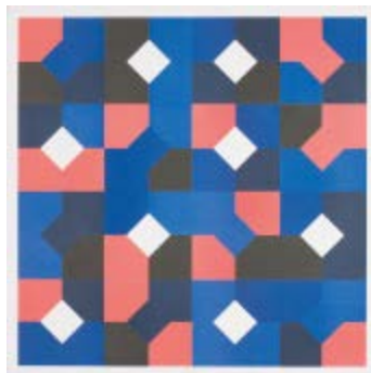
231 Bruno Munari (1907-1998) Base d'asta € 200 Curve di peano - Serigrafia su carta, es. 21/100 cm. 70x70 Firma in basso al centro