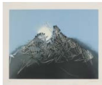
237 Emilio Scanavino (1922-1986) Base d'asta € 100 Senza titolo - Serigrafia su carta, es. p.a. cm. 60x73 Firma in basso a destra