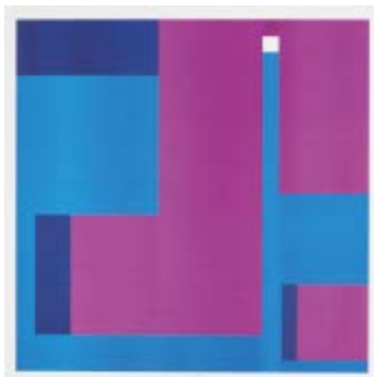
233 Bruno Munari (1907-1998) Base d'asta € 200 Negativo positivo - Serigrafia su carta, es. 48/100 cm. 70x70 Firma in basso al centro