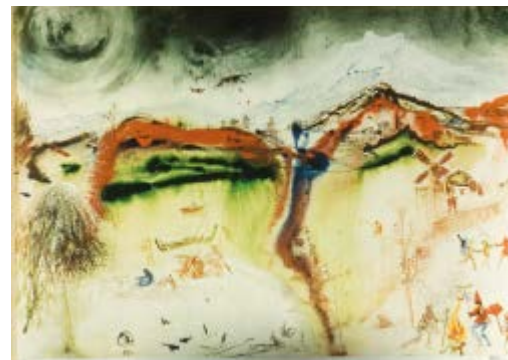
204 Salvador Dalí (1904-1989) Base d'asta € 500 L'inverno - Stampa su lastra d'argento 925/1000, es. 114/599 cm. 21x29 Certificato di garanzia con foto a cura della Les Heures Claires Edizioni d'Arte, Trento con timbro a secco di Salvador Dalí Firma stampata in basso a sinistra