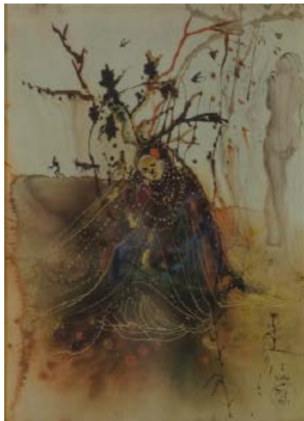
199 Salvador Dalí (1904-1989) Base d'asta € 500 L'autunno - Stampa su lastra d'argento 925/1000, es. 114/599 cm. 29x21 Certificato di garanzia con foto a cura della Les Heures Claires Edizioni d'Arte, Trento con timbro a secco di Salvador Dalí Firma stampata in basso a destra