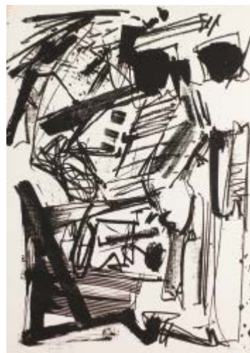
241 Emilio Vedova (1919-2006) Base d'asta € 200 Senza titolo - Litografia su carta, es. 70/84 cm. 70x50 L'opera presenta una piccola piega in alto a destra Firma in basso a sinistra