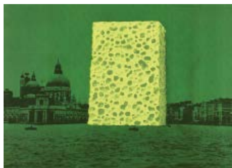
206 Fabrizio Plessi (1940) Base d'asta € 150 Senza titolo - Serigrafia su carta, es. 30/40 cm. 48x68 Firma in basso a destra