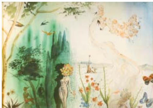
202 Salvador Dalí (1904-1989) Base d'asta € 500 La primavera - Stampa su lastra d'argento 925/1000, es. 114/599 cm. 21x29 Certificato di garanzia con foto a cura della Les Heures Claires Edizioni d'Arte, Trento con timbro a secco di Salvador Dalí Firma stampata in basso a destra